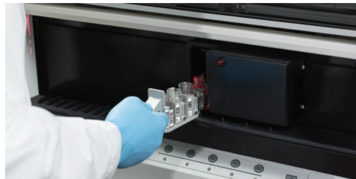
Hệ thống đọc mã barcode cho phép quản lý cho KTV trong quá trình chạy mẫu thuốc thử heo thời gian thực