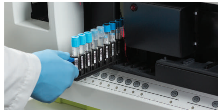
Ống nắp đóng giúp đảm bảo an toàn cho KTV trong quá trình chạy mẫu