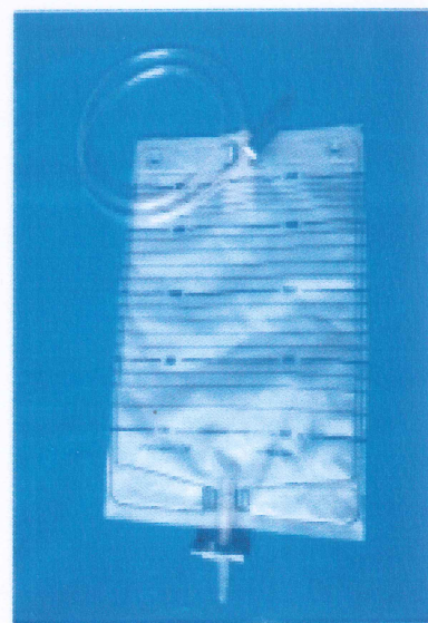
Túi nước tiểu