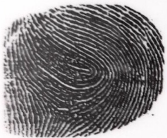
NGÓN TRỎ TRÁI

Đặc điểm nhân dạng: Nốt ruồi cách 1cm sau cánh mũi phải