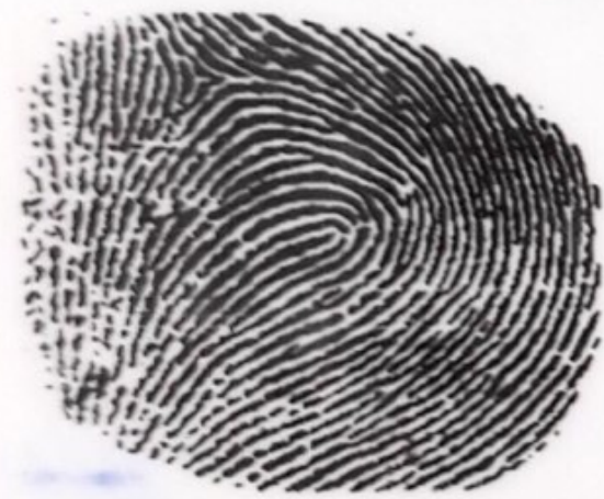
NGÓN TRỎ PHẢI

CỤC TRƯỞNG CỤC CẢNH SÁT ĐKQL CƯ TRÚ VÀ DLQG VỀ DÂN CƯ