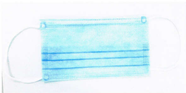
Hình ảnh mẫu